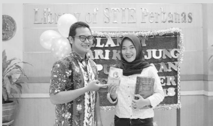
Foto: Dio Eka P. berikan voucher hadiah kepada mahasiswa yang menang. (14/09/18)

Voucher yang diberikan ini diwujudkan berupa kupon yang disebarkan di setiap sudut perpustakaan kampus 1 maupun kampus 2. Setidaknya ada 36 kupon yang disebarkan untuk ditemukan oleh para pengunjung. Lantas, mereka yang menemukan kupon nantinya ditukarkan dengan hadiah menarik yang sudah disediakan oleh pustakawan. Hadiah menarik yang disediakan pun beraneka macam, di antaranya: Voucher pembelian buku, lose leaf, paket spidol warna, blocknote, pulpen, dan lain