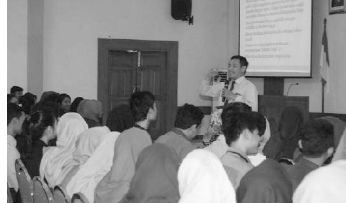
Foto: Mahasiswa dibekali materi sebelum kegiatan magang eksternal