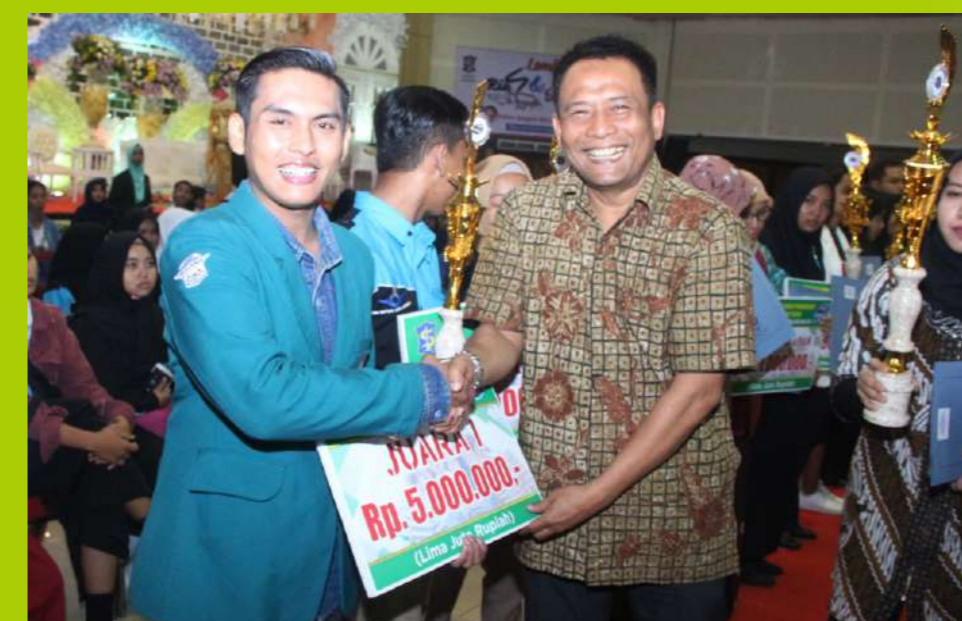
Ero Raih Juara I Program CSR Surabaya