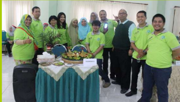
Foto: Kelompok 8 padukan perangkat IoT dengan Kreasi Masakan Mie