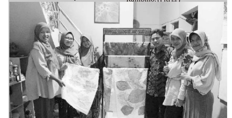
Foto: Dosen STIE Perbanas Surabaya menunjukkan hasil Batik Jumpitan, Selasa 6/11/18

"Pada dasarnya kegiatan yang sudah dilakukan oleh pelaksana atau dosen-dosen STIE Perbanas Surabaya ini sudah menunjukkan kontribusi yang besar terhadap penerapan IPTEK pada kelompok-kelompok mitra, tetapi dari penerapannya ini masih bersifat mono tahun. Jadi, para dosen perlu membuat lagi kegiatan yang bersifat multi tahun sehingga nantinya dalam pembinaan mitra ini bisa tuntas sampai mitra itu benar-benar mandiri," pungkas Yusuf Rumbino. (Fitri)