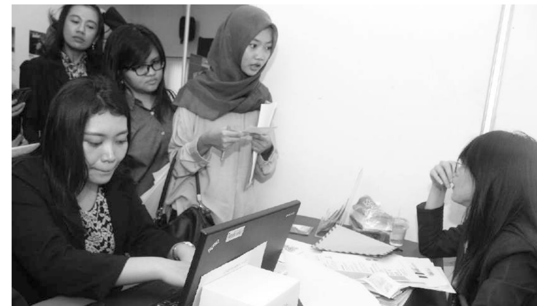
Foto: Jobseeker sedang konsultasi dan memasukkan lamaran kerja di salah satu stand bank peserta Jobfair

STIE Perbanas Surabaya kali ini bekerjasama dengan Ikatan Alumni STIE Perbanas Surabaya (IKAPNAS) menggelar acara Perbanas Banking Jobfair pada Kamis-Jumat, 15-16 November 2018 Pukul 09.00s/d 15.00 di Auditorium STIE Perbanas Jl. Nginden Semolo No. 34-36 Surabaya. Lebih dari 1.200 jobseeker (pencari kerja) memadati bursa lowongan kerja karena mereka bisa masuk secara GRATIS dengan membawa hasil cetak registrasi online di link http://register-jobfair.perbanas.ac.id .