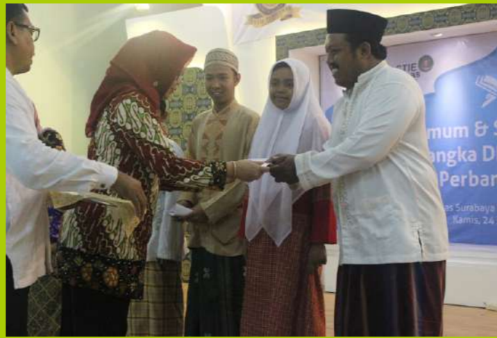
Foto: Dra. Gunasti Hudiwinarsih, Ak., M.Si. (baju batik), memberikan santunan kepada anak yatim dalam acara Pengajian Umum Dies Natalis 49