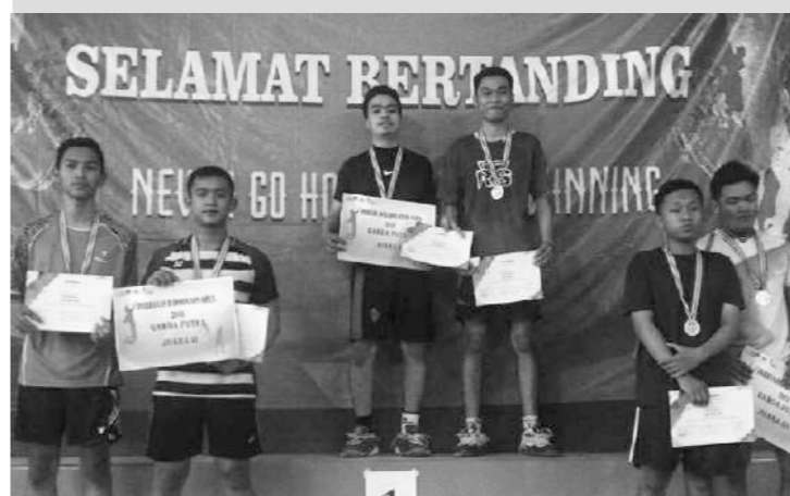
Foto: Pemenang Lomba Badminton Open 2018 oleh UKM Badminton

Pada hari minggu, 18 November 2018 UMKM Bulu Tangkis Perbanas Surabaya sedang mengadakan perlombaan bulu tangkis internal yaitu Perbanas Badminton Open. Acara yang berlangsung dari tanggal 10,11,17, dan 18. Acara yang berlangsung dalam waktu 4 hari ini berjalan dengan sangat ramai karena peserta dari Perbanas Badminton Open sendiri berasal dari anak pembinaan dari UMKM Bulu Tangkis serta mahasiswa/mahasiswi serta dosen dari STIE Perbanas Surabaya. Pertandingan pada tanggal 10 dan 11 berlangsung di stadium Soedirman, dan