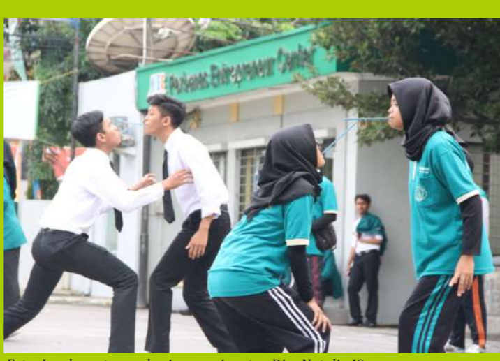
Foto: Lomba antar-mahasiswa peringatan Dies Natalis 49