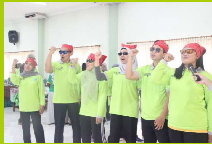
Foto: Kelompok 9 menampilkan Yel-Yel sebelum ikuti Lomba