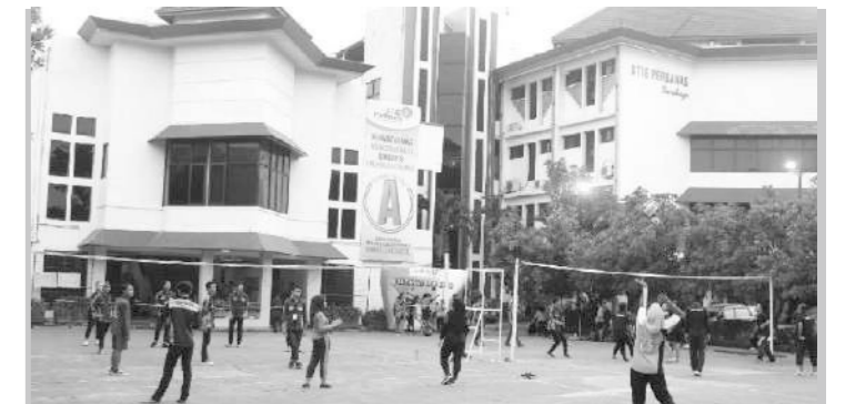
Foto: Siswa peserta Lomba Voli saat bertanding, Sabtu, 8 Desember 2018 (Fiducia)